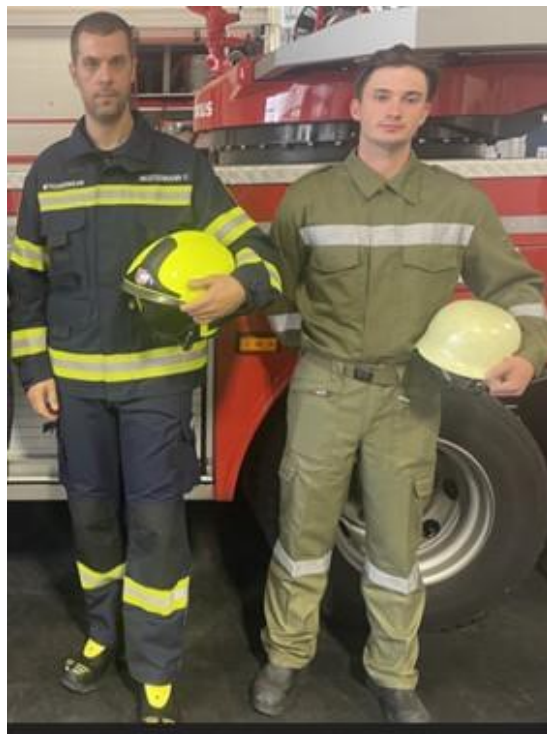
Einsatzbekleidung neu - alt

Förderwürdig ist die Beschaffung von Einsatzbekleidungen KS-03 ab 1. Oktober 2024. Die Förderabberufung wird in weiterer Folge ab 1. Jänner 2025 möglich sein. Hierzu ist eine Plattform in Ausarbeitung.